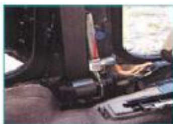
plaatsing onder in de Bstij