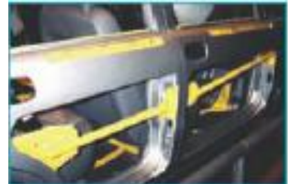
Verstevigingsbalken in portier