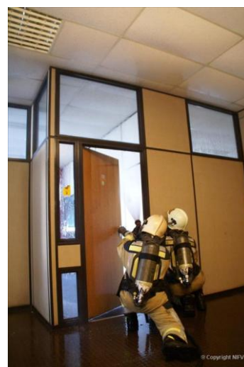
Opstellen bij afdraaiende deur