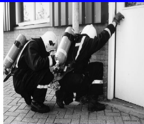
openen af- draaiende deur