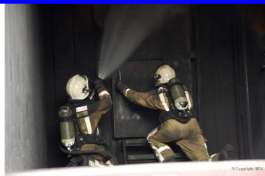
Korte pulsen boven deur