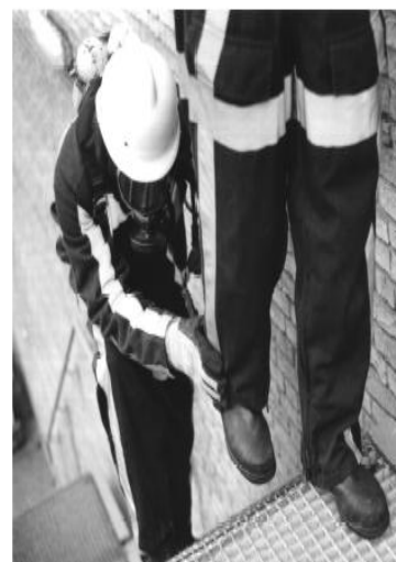
het afdalen van trappen oefenen