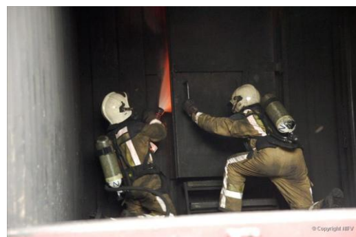
Nevelstoot door deur opening